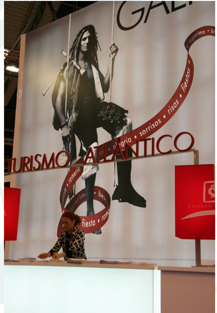
Imagen del Turismo de Galicia en la pasada edición de FITUR.

Así, por ejemplo, el día 30 de enero están previstas la presentación de Vigo como ciudad aspirante a la organización de la Universiada 2013; la promoción turística de O Salnés a través de